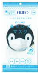
nepia 「鼻セレブマスク(5枚入)」