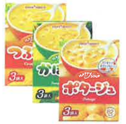
ポッカサッポロフーズ&ピバレッジ 「スーパギフトセット(3袋入3箱)」