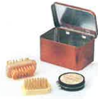
「シューシャインギフト」

ご来場の記念に左記の中 からご希望の品をおひとつ プレゼントいたします。下記 の「ご来場予約申込書」 に必要事項をご記入のうえ、 FAXにてご返信ください。